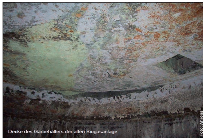
Decke des Gärbehälters der alten Biogasanlage

Besonderes Augenmerk wird man in diesem Zusammenhang künftig dem Magnesium schenken müssen. Dabei ist von größter Bedeutung, dass die mineralische Zufuhr als Magnesiumsulfat erfolgt, weil nur darin das