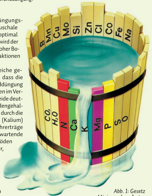
Abb. 1: Gesetz vom Minimum (von Justus Liebig): Wie die Tonne durch die ungleiche Höhe der Dauben nicht voll werden kann, so können auch die Pflanzen bei Mangel eines Wachstumsfaktors keine vollen Erträge bringen.

Die Entnahme von Bodenproben sollte so erfolgen, dass die zu beprobende Fläche ausreichend repräsentiert ist. Je Probe sollten deshalb nicht mehr als 5 ha einbezogen werden. Mindestens 20, besser 30 Ein-