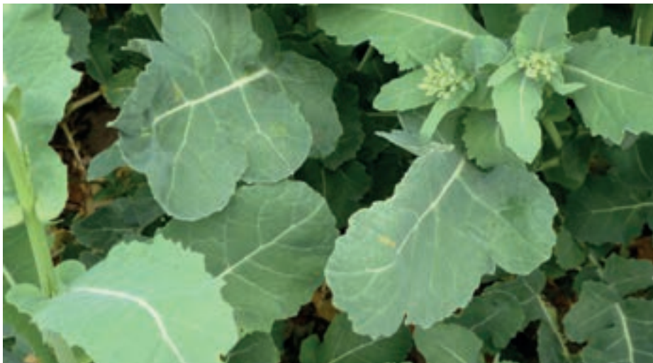
Raps im Feldversuch mit EPSO Top im April 2018.