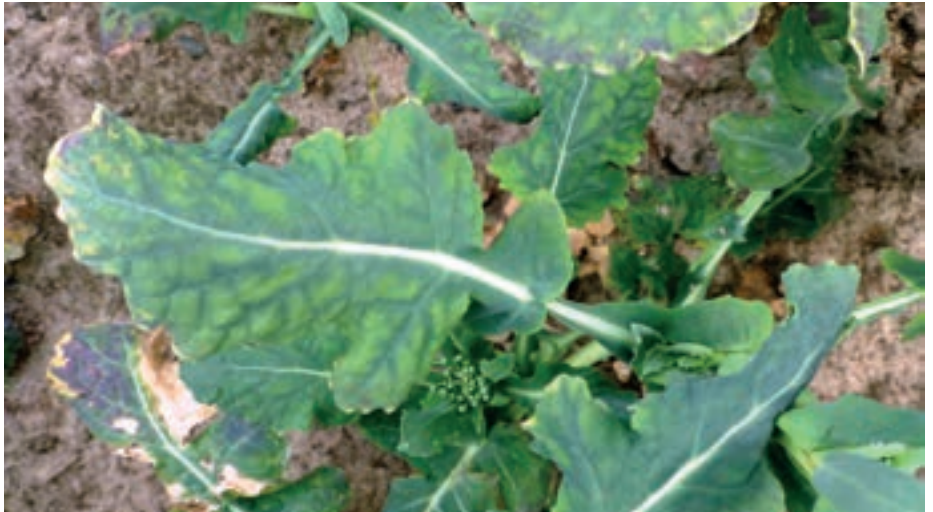
Kaliummangel im Knospenstadium. Dadurch kann weder eine ausreichende Verzweigung noch ein vollständiger Schotenansatz erfolgen.

Magnesium und Schwefel wirken im Stoffwechsel der Pflanze und sorgen so für eine verbesserte Ausnutzung von Stickstoff. Schwefel ist zudem Baustein verschiedener Aminosäuren, ohne die kein Protein gebildet werden kann. Dieser Nährstoff wird zu Teilen schon im Herbst und wieder ausgangs Winter sehr früh gebraucht und hier zunehmend noch vor der mineralischen Stickstoff-Gabe oder auch organischen Düngung appliziert. Er kann nur in Sulfat-Form direkt von der Pflanze aufgenommen werden. Der Schwefelbedarf von Raps liegt bei 40–50 kg/ha. Die Aufnahmekurven von Schwefel und Magnesium verlaufen in der angesprochenen kritischen Zeit fast parallel (Abb. 2, S. 35). Daher sollten beide Nährstoffe zu Teilen bereits früh im Herbst pflanzenverfügbar sein und z. B. in Form von 2 dt/ha ESTA Kieserit (25 % MgO, 20 % S) zu Vegetationsbeginn bedarfsdeckend platziert werden.