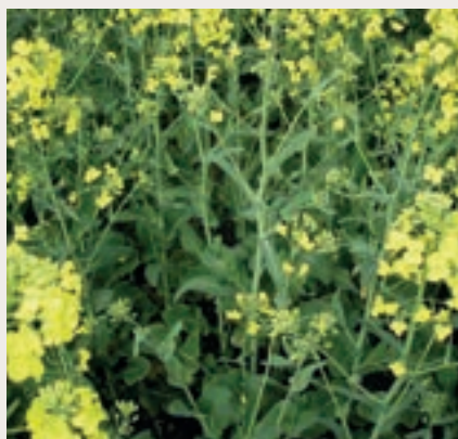
Raps mit Korn-Kali und intakter Blüte.