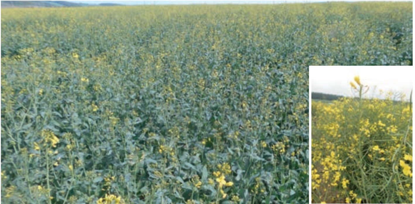
Physiologische Knospenwelke beim Körnerriaps. Dies bewirkt später einen mangelnden Schotenansatz.