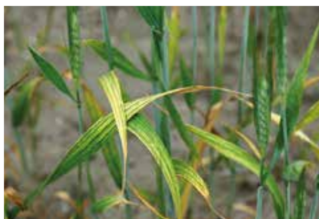
Συμπτώματα τροφονεμίας Μαγνησίου σε διάφορες καλλιέργειες σιτηρών

Τροφονεμίες σε θρεπτικά στοιχεία για τα σιτηρά μπορείτε να δείτε στο site: http://www.kali-gmbh.com/uk/en/fertiliser/advisory_service/deficiency_symptoms/cereals-k.html