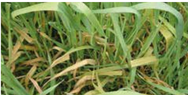
Συμπτώματα τροφοπενίας Καλίου σε διάφορες καλλιέργειες σιτηρών